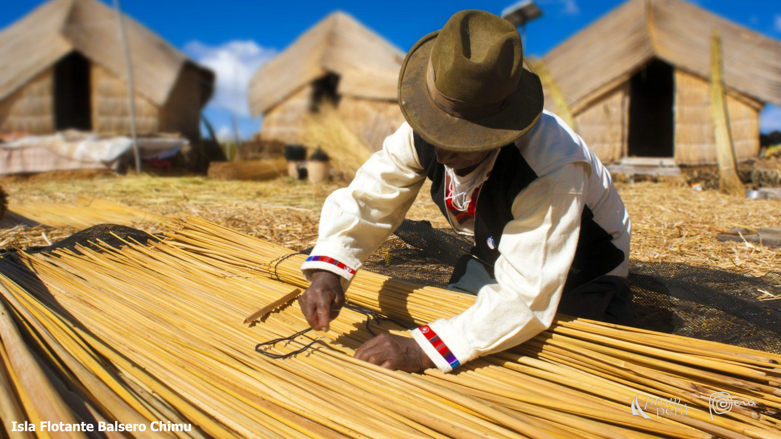
Isla Flotante Balsero Chimu