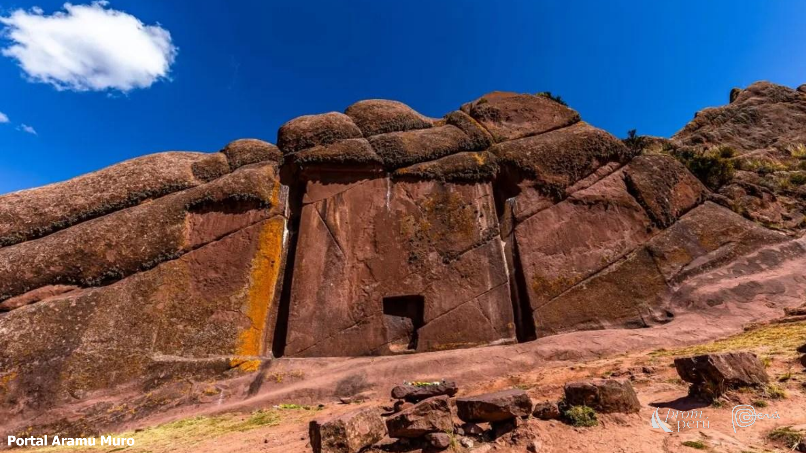
Portal Aramu Muro